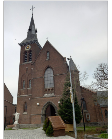
De Sint-Hadrianuskerk Wijgmaal,

We zijn kleine mensen op deze wereldbol, maar we kunnen allerlei goede initiatieven nemen. Het is dankbaar te zien dat je daarin niet