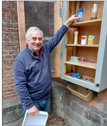
...aan de buitenmuur van de kerk: ons voedselkastje

zen verderop woont – opent 's morgens de kerk en sluit die 's avonds af. Drie keer per dag maakt ze de tafel leeg en bergt de donaties op in onze voorraadkamer. Elke dag plaatsen we voedingsmiddelen in het kastje aan de muur. En elke morgen is dat voedselkastje leeg.