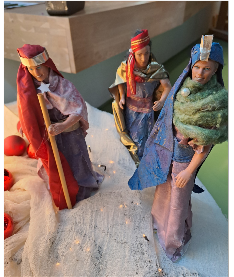
Bij het verhaal van DE WIJZEN UIT HET OOSTEN blijft bij mij een gedachte bovendrijven: Het nieuwe kan uit een onverwachte hoek komen.

3. Het paleis van Herodes in Jeruzalem: bolwerk vol dreiging, onrecht, machtsmisbruik, angstaanjagende uitspraken en maatregelen, schijn-heiligheid, levensbedreigende politiek en economie, Wie of wat maakt mij bang? Doet mij pessimistisch naar de toekomst