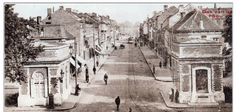
Tiensesteenweg vanuit Tiensepoort rond 1925. Rechtsboven het kloosterdak van de "Sou". In de verte de stadstram "3C.Tiv" van Leuven centrum naar Tivoli.

Uit "Een huis vol mensen" - Boek nog verkrijgbaar.