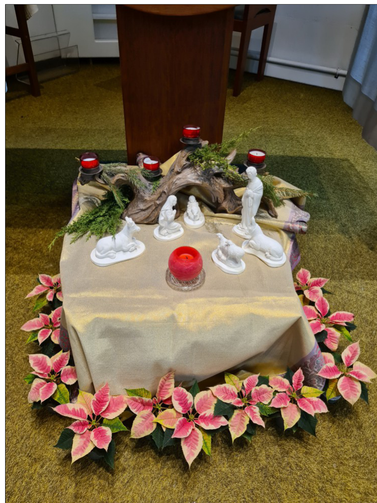
Kribbe in de Sint-Franciscus weekkapel

(Joanna is een fictieve naam) https://dedagdanst.wordpress.com/2025/01/02/schouwen/