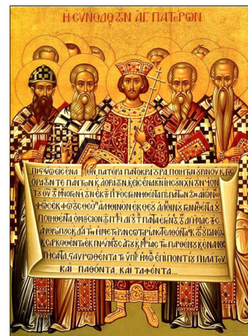
Concilie van Nicea

Dit jaar herdenken christenen dat 1700 jaar geleden, in 325 na Christus, het eerste christelijke oecumenische concilie in Nicea bij Constantinopel plaatsvond. Een unieke kans om te reflecteren op het gedeelde christelijke geloof, zoals uitgedrukt in de geloofsbelijdenis die