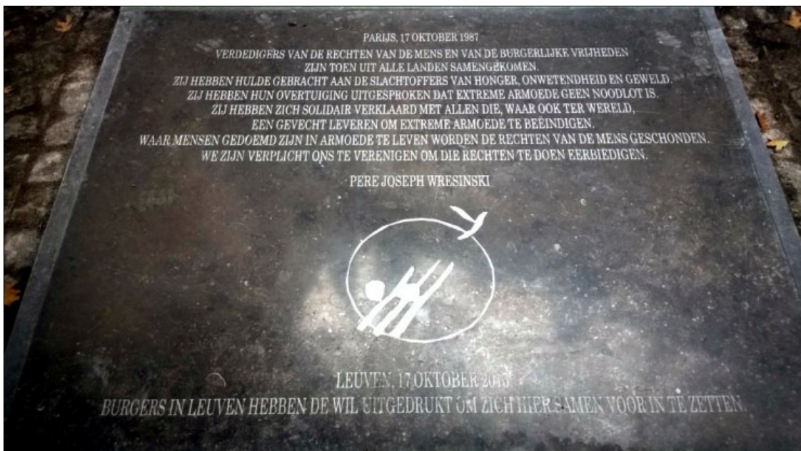
Om 14 u start op het Martelarenplein een stille optocht richting Grote Markt, waar we om 14.45 uur een herdenkingsmoment hebben aan de Steen tegen Armoede.

“Kansarmoede” verwijst ook heel uitdrukkelijk naar uitsluiting, naar een gebrek aan kansen om een volwaardig en menswaardig bestaan uit te bouwen. Het gaat vaak over een samenloop van omstandigheden: geen geschikte of aangepaste woning, een tekort aan middelen om te kunnen voldoen aan