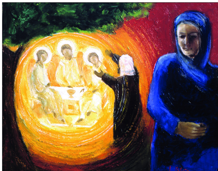
Abraham eik van Mamre door kunstenaar Luc Blomme

In het Oude Testament maken we kennis met heel uiteenlopende godsbeelden. Hoe kunnen we ze rijmen met elkaar en zijn ze bepalend