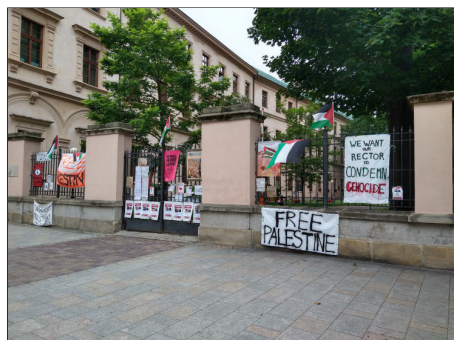
Protest op de universiteit van Krakow