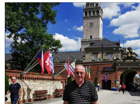
Bij de ingang van het klooster van Jasna Gora