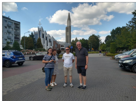
Aan de kerk van Maximiliaan Kolbe