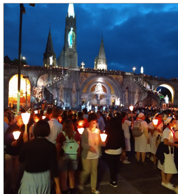
Een impressie op het einde van de kaarsjesprocessie

De duisternis valt. Hoog boven op de toren van de Rozenkransbasiliek in Lourdes wordt de klassieke beeltenis van Maria in de grot geprojecteerd. Zo laat ze zich hier zien als een Hemelse Vrouw. Ze verschijnt als het ware alle dagen na de kaarsjesprocessie aan mensen om haar gelovige boodschap en oproep aan hen te brengen. Ook vandaag dus. Het lijkt mij een rechtstreekse intro voor een artikel naar aanleiding van de hoogdag van Maria-Tenhemelopneming. Ik had de redactie een verslagje beloofd over mijn bedevaart naar Lourdes met het bisdom Antwerpen. Ja, ik ging vreemd. Hadden ze mij als Leuvenaars in het hotel 'Stella' laten verblijven om zeker te zijn dat ik mij zou thuis voelen in deze compagnie?