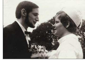
Huwelijk in 1970