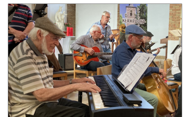
Nu, iets grijzer, pianist bij de Kerkpoortclochards