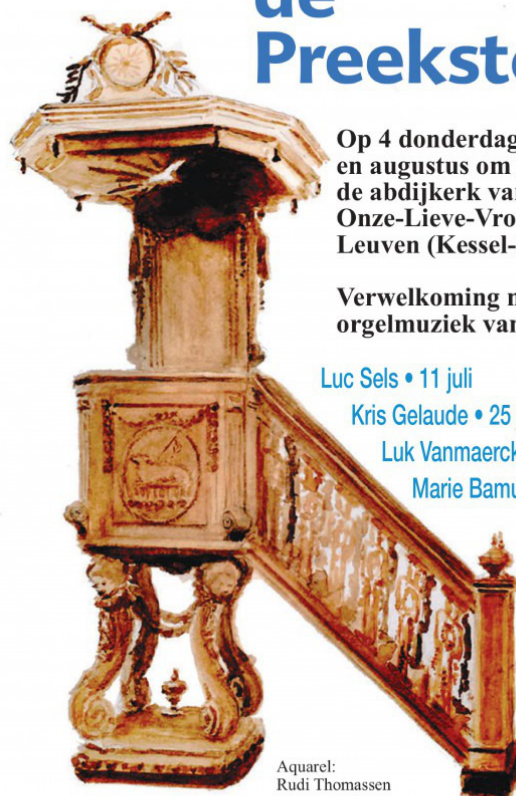
Aquarel: Rudi Thomassen