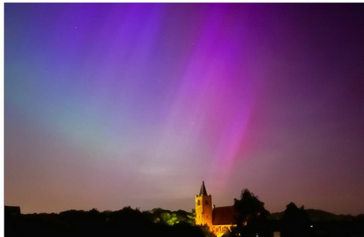
Het Noorderlicht boven Leuven.

Binnenkort kunnen de meesten onder ons genieten van een welverdiende zomervakantie. Ook onze wekelijkse editie van Kerk&Leven schakelt naar een lagere versnelling.