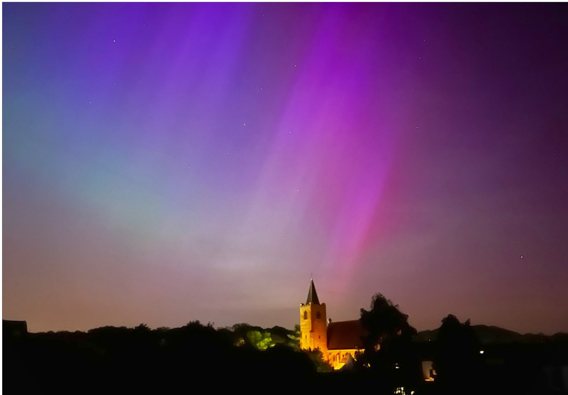
Het Noorderlicht boven Leuven.

Ook in onze regio was het Noorderlicht goed zichtbaar en trokken fotografen de baan op om het natuurfenomeen vast te leggen.