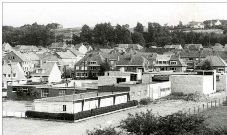
Zicht vanuit de Albertbuilding rond 1970 - bemerk ook de nog vrij kale Trolieberg