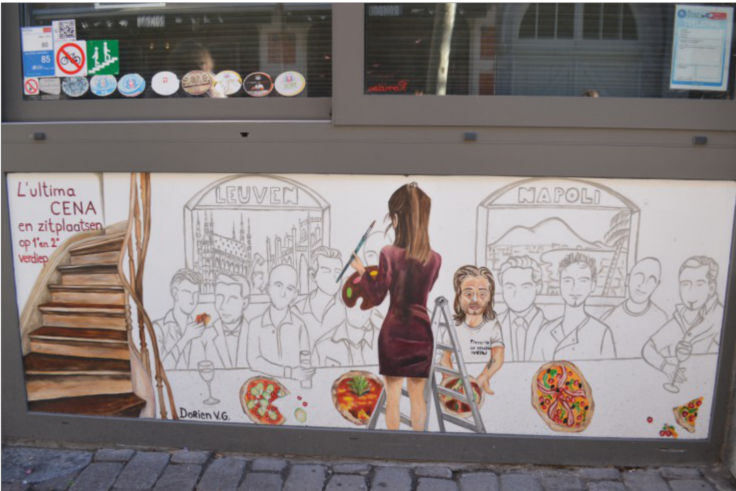
Gevelschildering pizzeria Marco