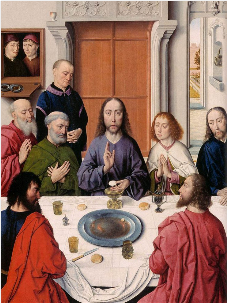
Dieric Bouts - Het laatste avondmaal (detail)

Sinds het najaar van 2023 was Leuven helemaal in de ban van het Dieric Bouts Festival . Voor deze gelegenheid kwamen de topwerken van