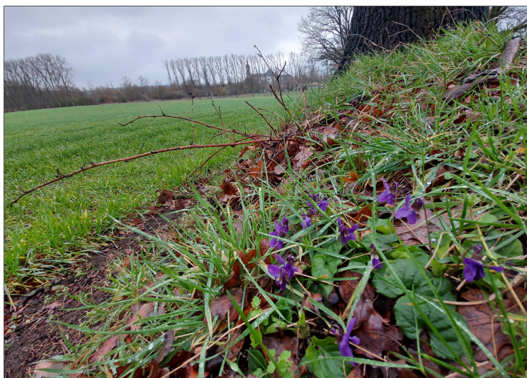
maarts viooltje op berm langs A. Thymdreef