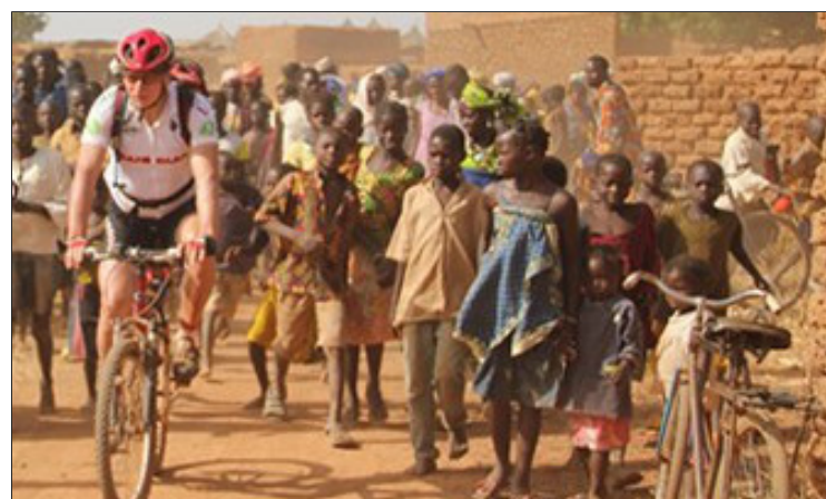
Jeffietste in 2010 voor Broederlijk Delen in Burkina Faso

Meer info op de website van ademtocht.be op volgende link: https://ademtocht.be/JeffietstDDVL