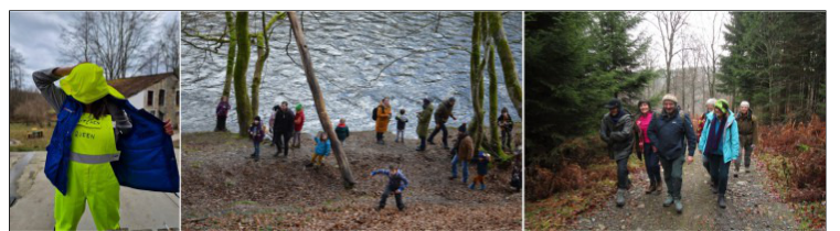
Klussen - MutskesWE - Lentewandeling

Info: https://www.moulindebellemeuse.be/activiteiten