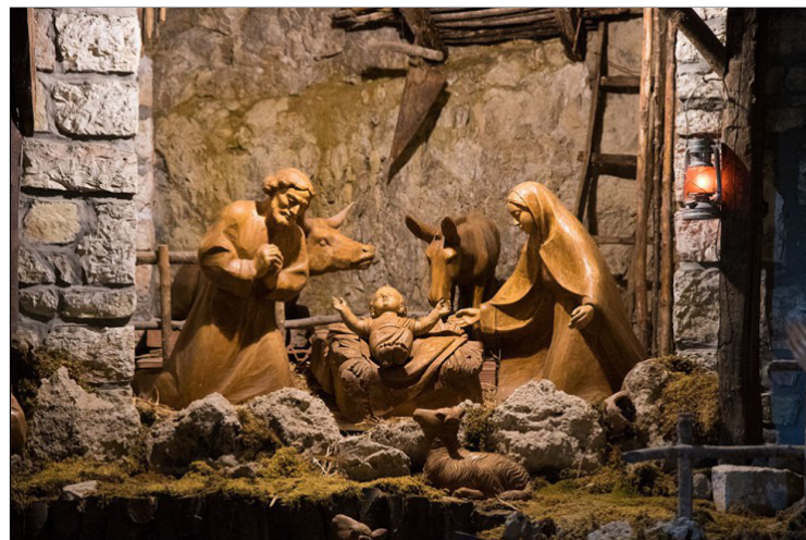
kerststal in Greccio

Beeld u eens in dat iemand langskomt en tegen u zegt: Zorg voor een plaats in het bos, graag ergens waar er stro ligt. Laat de mensen 's nachts naar het bos komen met fakkels. Daar zullen we kerst vieren. Beste mensen, dit gebeurde 800 jaar geleden.