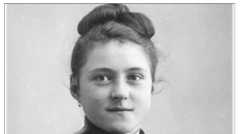
Theresia van Lisieux