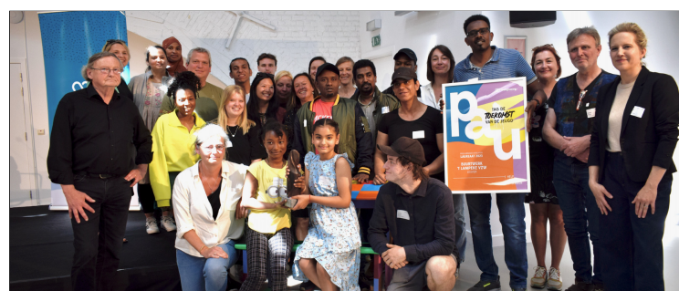
Prijs "Armoede uitsluiten"

Welzijnszorg ondersteunt al vele jaren buurtwerk 't Lampeke in Leuven. Dit buurtwerk levert al vijftig jaar pionierswerk wat betreft de bestrijding van armoede. Dit jaar wonnen ze ook de 24ste prijs 'Armoede uitsluiten' van Welzijnszorg onder meer vanwege hun volgehouden inspanningen naar kinderen en jongeren toe. Meer informatie over 't Lampeke vind je op www.lampeke.be .