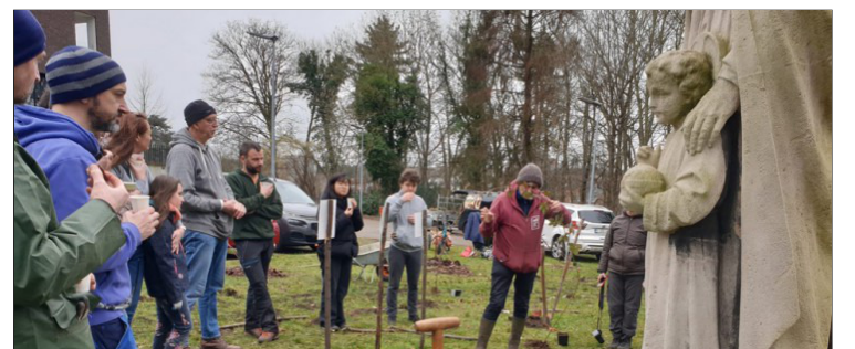
(c) © Erik Vanleeuw