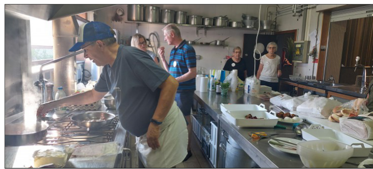
Actie in de keuken

Al vroeg in de ochtend werd de zaal Pakenhof omgetoverd tot een mooie ontbijtruimte met een buffet om "U" tegen te zeggen. In de keuken was het even een race tegen de tijd, maar alles stond perfect klaar om 8u om 43 mantelzorgers te verwelkomen en eens lekker te verwennen met alles wat je bij een ontbijt kan bedenken.