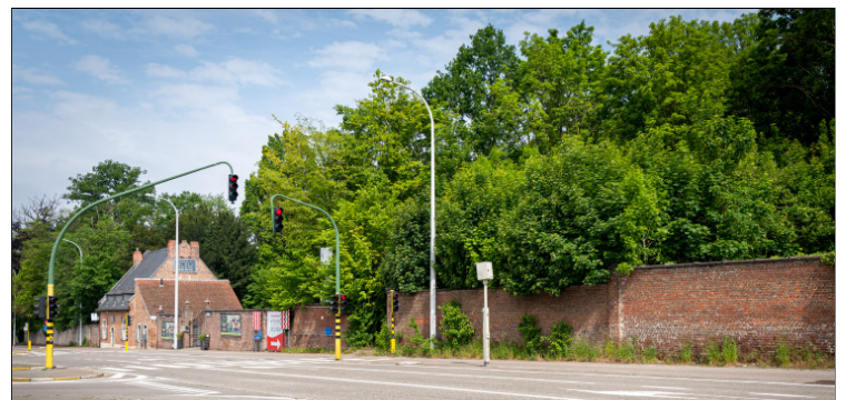
Er is een rechtstreekse verbinding met de Tienstesteenweg.