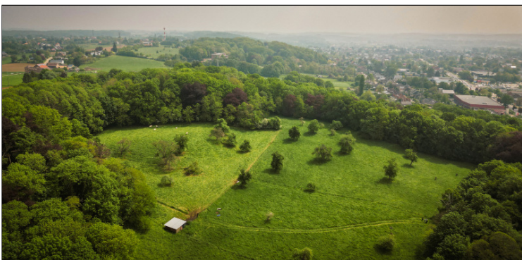
Op de flanken van de Predikherenberg ligt het park van 7,5 hectare

Op de groene flank van de Predikherenberg komt in 2024 een bijzonder natuurland van 7,5 hectare.