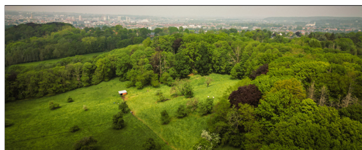
Stadspark "de Bunswyck" langs de Tiensesteenweg

In 1937 werd het volledige domein aangekocht door de familie Hot-