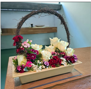
Bloemen door Monik Massie