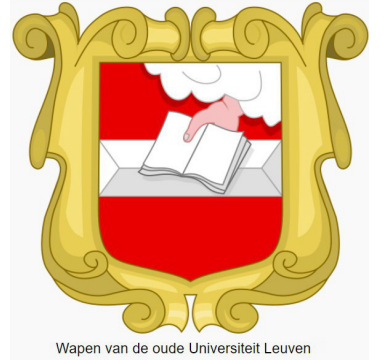
Wapen van de oude Universiteit Leuven

Wij hebben het er eigenlijk niet over gehad, maar de brouwerij had in 't begin van de stichting en start van de Universiteit een Bank functie , 't is te zeggen, elke prof die aan de Unief doseerde kreeg als betaling (vergoeding) maandelijks een aantal liter bier, en had recht op een aantal meter betere, mooiere stoffen voor hun kleding. De proffen die in rangorde konden klimmen, konden na promotie, aanspraak maken op een aantal flessen wijn. Aangevoerd vanuit Frankrijk, was dit reeds een kostelijk grapje. En indien er een prof terug degradeerde, kon het zijn dat hij geen wijn meer kreeg, maar wel nog bier. Vandaar het gezegde "Wijn na bier geeft plezier, bier na wijn is venijn".