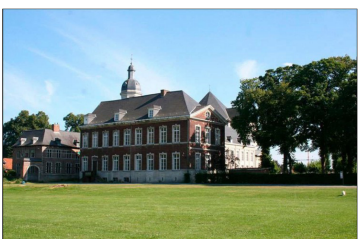
Abtskwartier Vlierbeek

Mind the Gap Leuven is partner van de Europese en internationale A Way Home beweging ( www.awayhome.eu ).