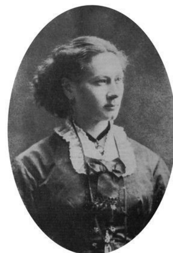
Dokteres Isala Van Diest

De Leuvense Isala Van Diest was de eerste vrouwelijke arts van België. 137 jaar geleden gaf een Koninklijk besluit haar de toestemming haar beroep uit te oefenen.