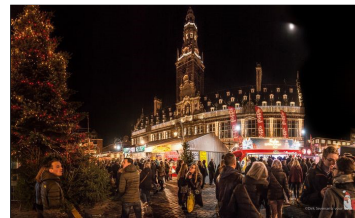
Leuvense Kerstmarkt gaat niet door

De organisatoren van de Leuvense Kerstmarkt hebben beslist om de editie van eind dit jaar te annuleren. Reden is uiteraard de vierde coronagolf en het staat in de sterren geschreven dat er nog grote events zullen volgen.