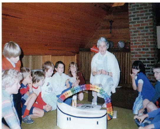
Kringgesprek met het eerste leerjaar