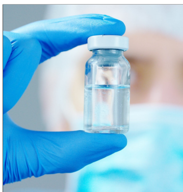
Op zoek naar Coronavaccin

Aan vele onderzoekcentra wereldwijd, waaronder ook de KU Leuven, wordt koortsachtig gewerkt aan een doeltreffend vaccin tegen het coronavirus.