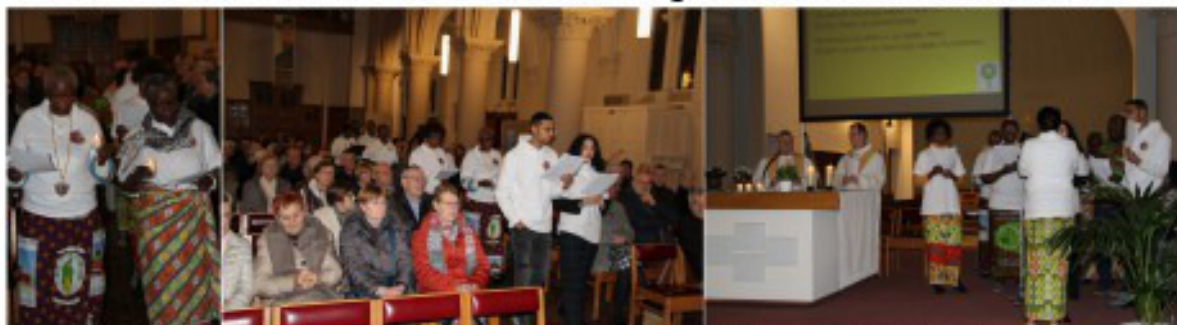
De eucharistieviering werd dansend en zingend opgeluisterd door een Congolees koor.

Op zaterdag 8 februari 2020 waren we met ruim 120 voor een geslaagd verjaardagsfeest van de PaZo KesseLinde in de kerk en in de zaal 'De Kring' in Blauwput: één jaar vruchtbare en constructieve samenwerking tussen zeven parochies! De takken maken de boom en de boom draagt en verbindt de takken. Elke tak is anders en toch vormen ze samen één geheel.