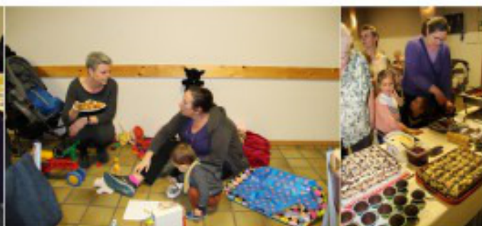
Dank aan alle aanwezigen en de vele helpende handen bij de voorbereiding en op de feestelijke avond!