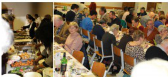
En dan mochten wij genieten van een heerlijk, gevarieerd Afrikaans buffet. Wij laten jullie graag mee proeven!