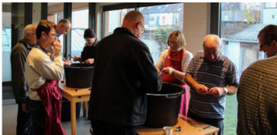
met vroege mosselkuisers

Het was weer een geslaagd en gezellig mossel feest!