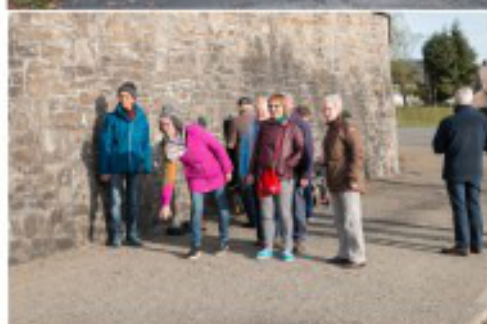
Petanque: gooien en klinkt het niet dan botst het maar