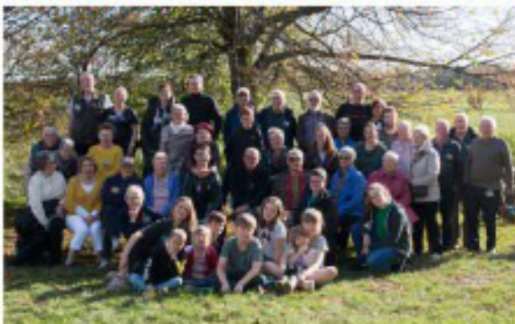
Met 48 waren we, jeugd van nu en jeugd van toe, in Wanne voor een heerlijk ontspannend weekend.