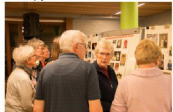
Foto's uit onze kindertijd herkennen, dat is ambiance