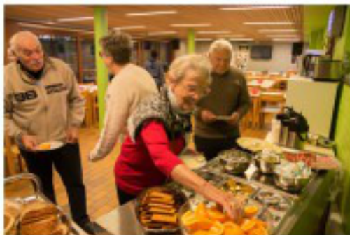
Een heerlijk ontbijt, laat het smaken