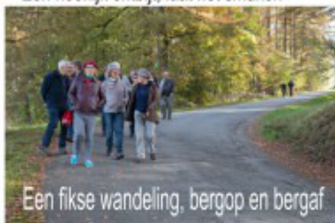
Een fikse wandeling, bergop en bergaf