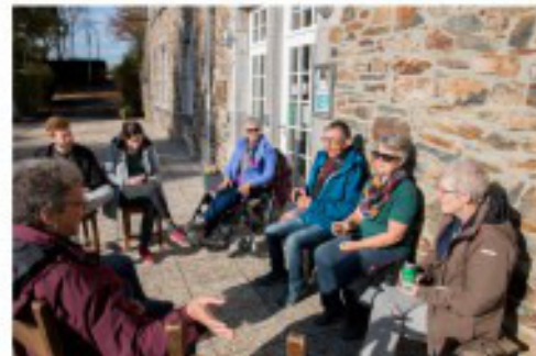
Lekker verpozen in het zonnetje