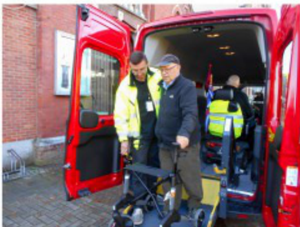
Aangepast vervoer maakt dat iedereen erbij kan zijn.

Waar halen die mensen die wijsheid? En waar zit de bron van de deugd die ze beleven aan die zorgende inzet? Wie heeft die mensen zo gemaakt? Misschien zijn het hun ouders, hun omgeving, hun grote voorbeelden. Of misschien is er iemand die ons met elkaar wil verbinden en die in ons oor fluistert: "Geen mens mag vereenzamen". En legt die iemand in ons de overtuiging: Elk mens is een schat. Het is aan zijn medemens om die schat te ontdekken. (naar Jef Sanen)