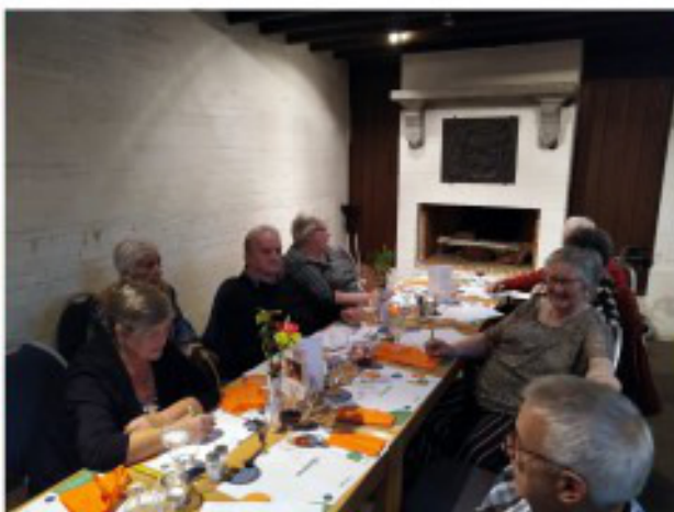
Gezellig samen aan tafel.