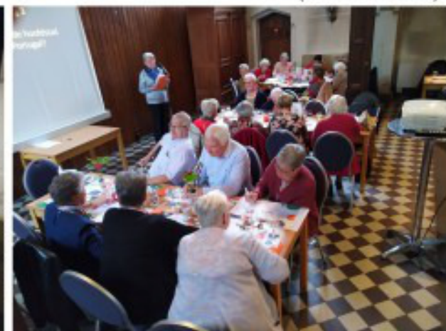
Wie wint de quiz, wie is de 'slimste mens'?