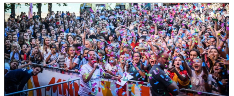
Strafste School – 2 september 2019

Leer je digitaal fotoestel kennen en gebruiken. Dan kun je hier individuele hulp krijgen. Iedere woensdagvoormiddag (behalve vakanties) vanaf 10 u. kan je hiervoor bij Seniorama terecht. Inschrijven 016 22 20 14. Merk en type van fotoestel opgeven. Bijdrage: € 5, vooraf te betalen. Meebrengen: fotoestel. Toestel moet opgeladen zijn.