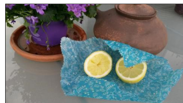
Maak zelfje bijenwasdoek