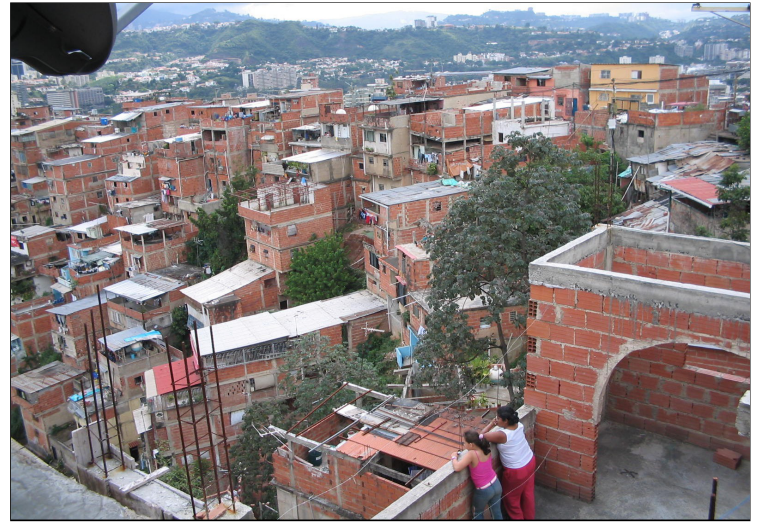
Caracas - Campo Rico

Een leraar vertelde me dat twee weken na het begin van de lessen in januari nog slechts 140 van de 400