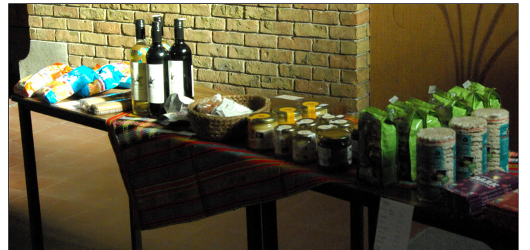
Achteraan stand van de wereldwinkel: Producten aan een eerlijke prijs!

Goede God, uw kruis is voor ons een teken van hoop. Wij geven het deze jongens en meisjes mee op hun levensweg. Maak van hen en van ons allen liefdevolle mensen, geloofsgetuigen van uw vrede. Kijk niet naar ons uiterlijk, maar naar ons hart, zodat wij als de gelukkige prins en de zwaluw uw vreugde mogen ervaren en nu reeds mogen voelen wat het is te leven in uw Koninkrijk. Amen.