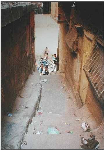
Caracas - Straatje in Campo Rico

de huidige situatie in Venezuela. Vooral hoe de mensen het beleven en waarom ze uit hun land willen wegtrekken.