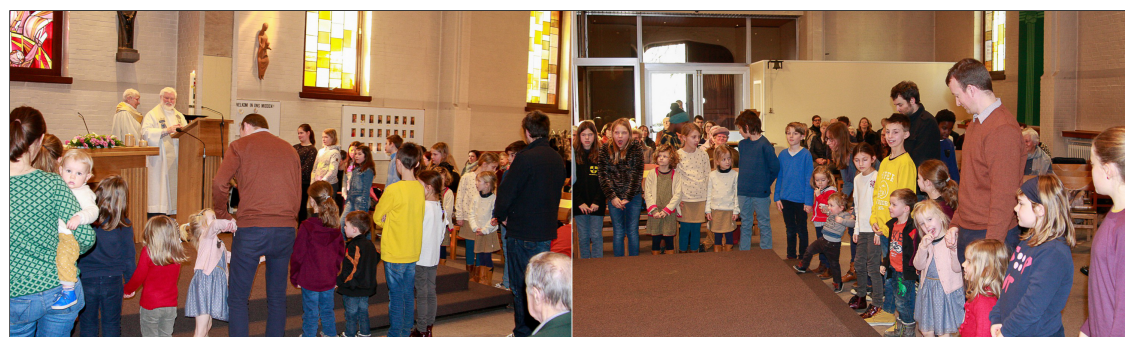
Zegen deze kinderen en hun ouders, zegen ons allen

dopen. Hierbij vertrouwen zij het kindje toe aan God en bidden zij om steun en kracht om goede ouders te zijn.