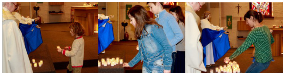
De kinderen, de papa's of mama's met hun baby plaatsen een kaarsje bij Maria en het kind Jezus