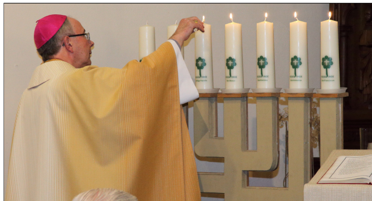
Het aansteken van zeven zonekaarsen, voor iedere parochie één.