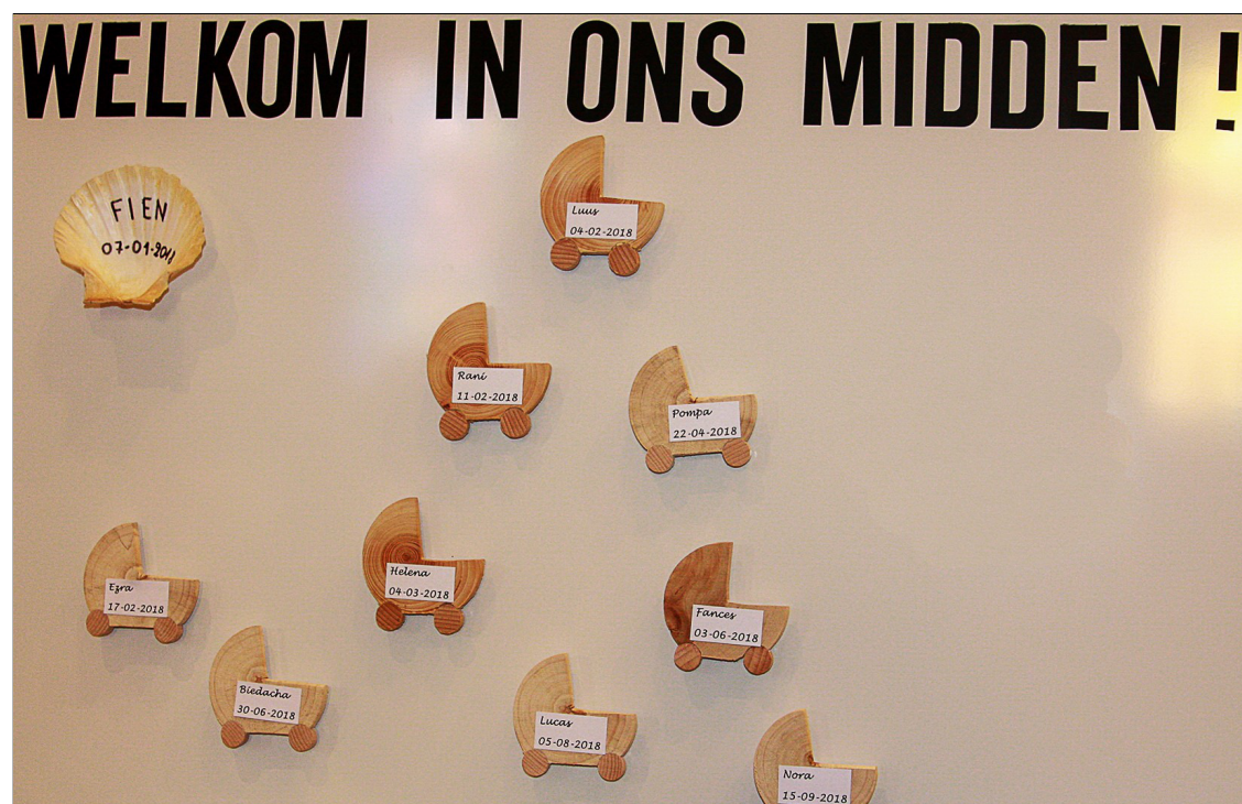
De kindjes die we in het voorbije jaar door het doopsel mochten opnemen in onze geloofsgemeenschap