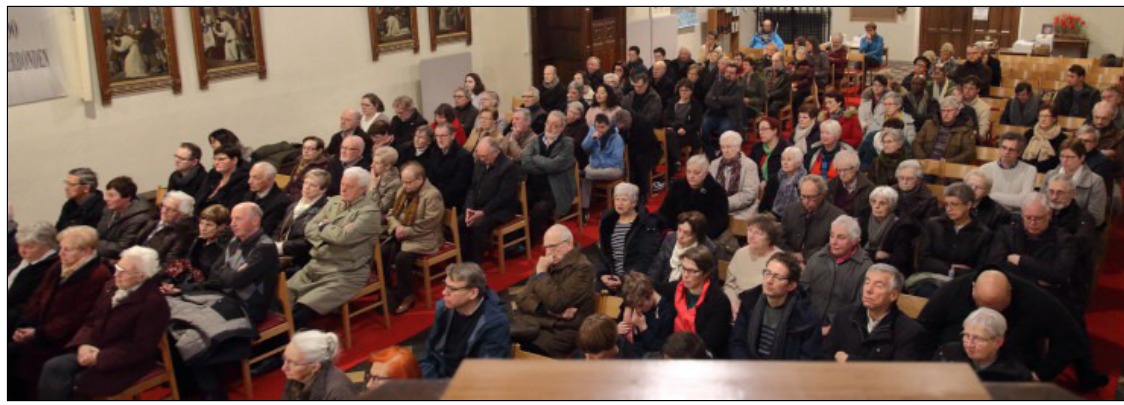
"Ieder van u heeft de taak om mee te bouwen aan de pastorale zone, niet alleen de veldverantwoordelijken of zoneploeg. Allemaal zijn we vissers van mensen".