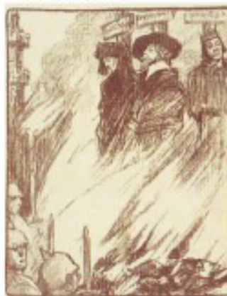
Louis Raemaekers. De Kunst gekruisigd Leuven, Universiteitsarchief, Verzameling Eerste Wereldoorlog

De komst van de nieuwe beiaard was de inspiratie voor deze tentoonstelling