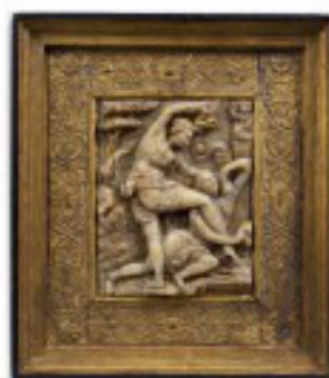
De moord van Kaïn op Abel 16e eeuw - Luik, Grand Curthus

Verwacht je aan kunst- en culturobjecten uit diverse religieuze en museale collecties, en hedendaags werk van enkele internationale namen.