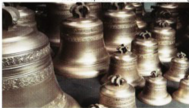
De nieuwe Vredesbeiaard in de Abdij van Park weerklinkt 100 jaar na de Wapenstilstand voor vrede en samenhang