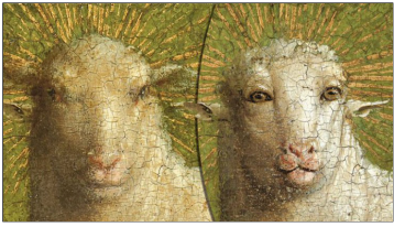
Het Lam Gods - Foto: www.lukasweb.be (C) Sint-Baafskathedraal Gent

Welkom in deze viering rond deze kaars, het oude en nieuwe testament en de kop van het Lam Gods uit het schilderij van Van Eyck.