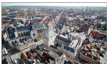
Stadcentrum - Het Nieuwsblad - 20 april 2018

Groot volksfeest om vernieuwing van het stadscentrum in de kijker te zetten: