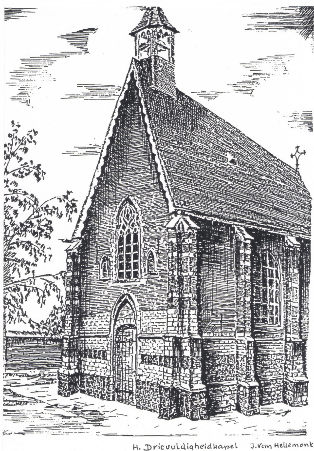
H. Drieuldigheidskapel J. van Hellemont