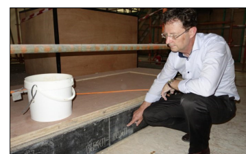
Vijftien opschriften in de originele trappen rond het altaar van de Sint-Pieterskerk in Leuven.

De restauratie van de Sint-Pieterskerk in Leuven legde de voorbije weken een bijna vergeten eerbetoon aan de slachtoffers van de Tweede Wereldoorlog bloot. Verstoep onder een podium staan vijftien namen van concentratiekampen gegraveerd.