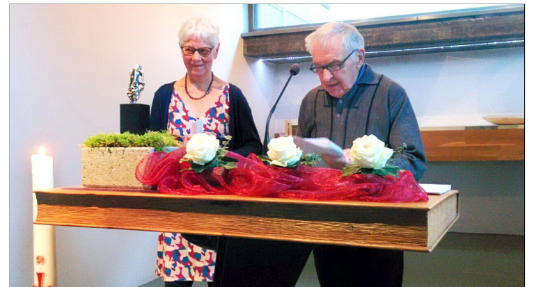
Jos aan het woord