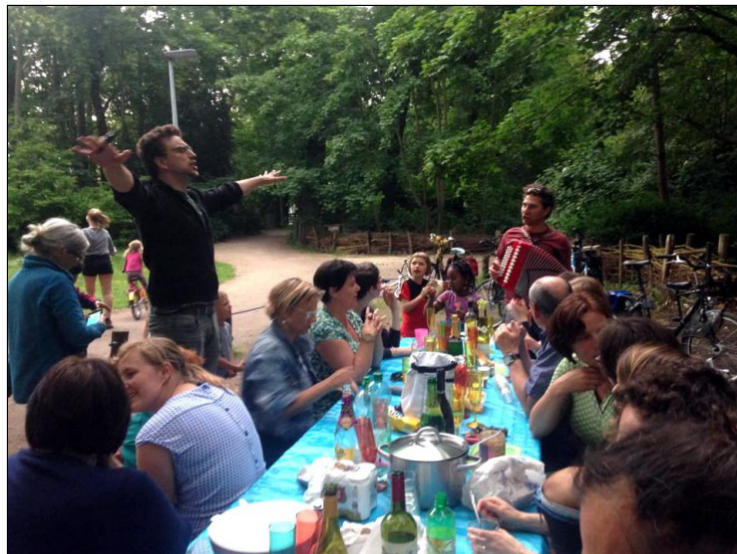
Dag van de Buren mei 2017 in het Michottepark

Woensdag 31 januari NM: SAMANA - Bingo 20u.: Koor Blij Rondeel