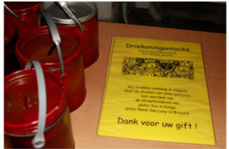
... en dan op stap!