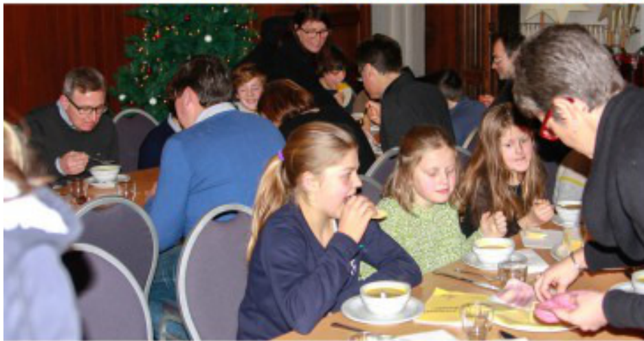
Eerst een warme kom soep en een boke...