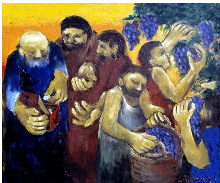
Werkers van het elfde uur