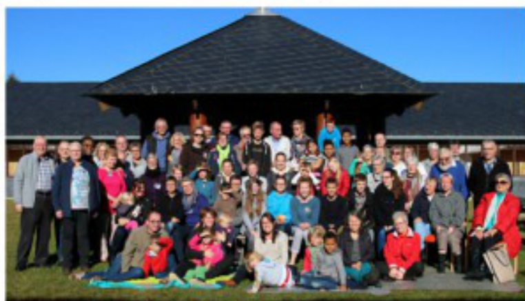
Herfstweekend 2016 in Sankt-Vith