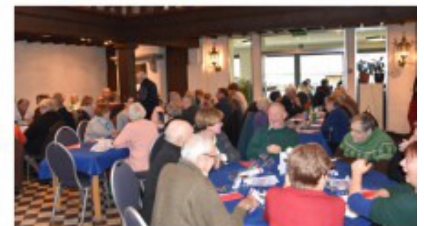
Gezellige en fijn verzorgde feesten Franse zondag 2017