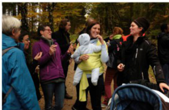
Lachen doet zo'n deugd..... Herfstweekend 2016