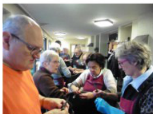
Vele handen maken het werk licht