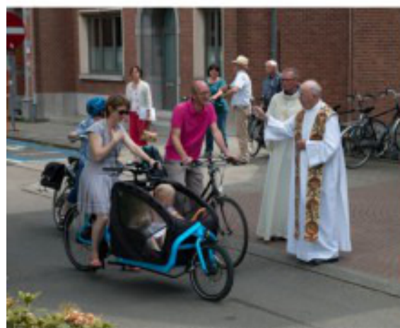
Kristoffelviering en zegening van de weggebruikers