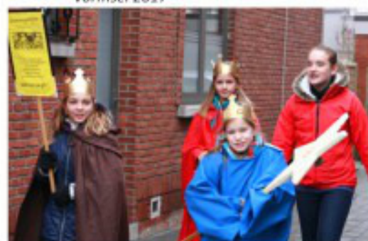
Driekoningentocht: zingen van deur tot deur voor kinderen die het minder goed hebben

Ontvangt u graag per mail een uitnodiging voor vieringen en/of activiteiten?