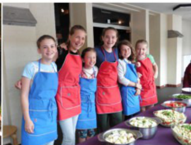
Onze jonge, enthousiaste ploeg