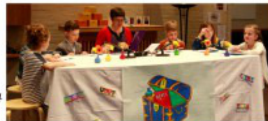
Eerste Communie 2017