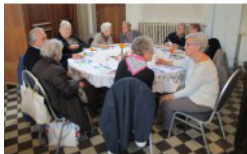
Samana doorbreekt de eenzaamheid van zieken en ouderen