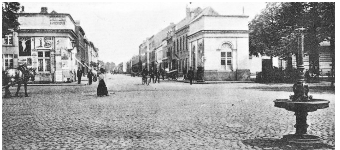
1890 - De toerist die, vanuit het Leuvense station, Heverlee aandoet, komt eerst aan de Tienesepoort, waar de Tienesesteenweg Kessel-Lo (links) en Heverlee (rechts) scheidt; de fotograaf stond op Leuvense grond naast de sierlijke Montefiori-fontein met drinkbak voor de paarden. De stadspoort uit de veertiende-eeuwse ringmuur werd in 1823 vervangen door de octrooihuisjes, die tot 1860 dienst deden. Bemerkt naast het rechter gebouw de brievenbus... en dat van de H.Hart kerk op de Tienesesteenweg nog geen spoor is.

Vervolgt met het ontstaan van de Sint-Antoniusparochie - Leo P.