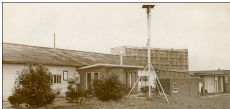
Kerk Don Bosco anno 1959