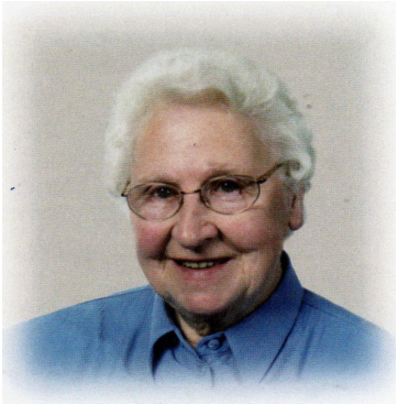
Zuster Emilienne - foto: Pues vervolg van pagina 1