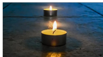
Vormingplus - Wandeling

Kleine intieme plaatsen in parken en steegjes, historische maar ook nieuwe gebouwen die stilte bieden, beelden die doen stil vallen, landschapselementen die doen verstillen. Het kan allemaal op deze stiltewandeling door Leuven. We ervaren de stilte in de stad op een aantal van de plekken die we passeren. We