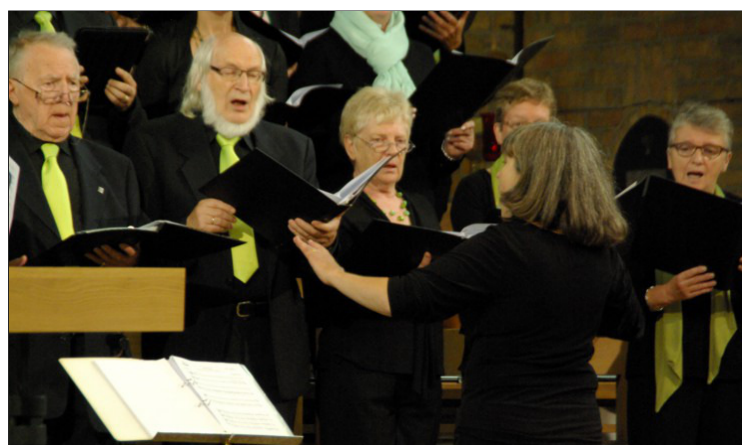
Slotlied: Ik zal voor de Heer van het Lied staan met niets anders op mijn tong dan een loflied. Hallelujah - L. Cohen

Daarom zeggen we nu met een bloemetje, bedankt en hopelijk tot ziens.