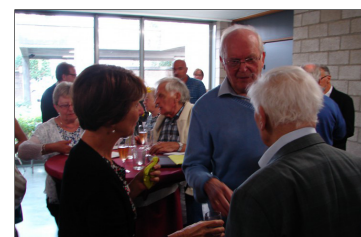
Receptie na de viering