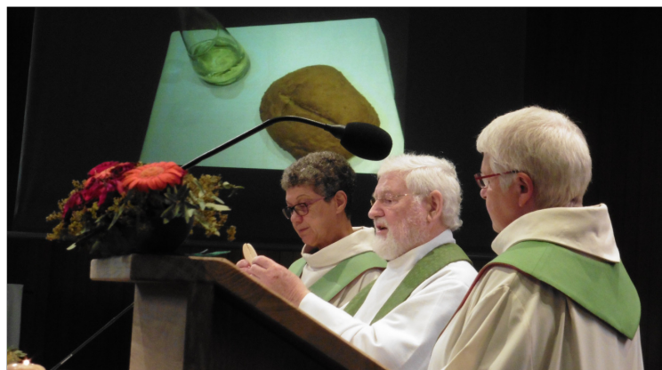
Dankbaar vieren met op de achtergrond beelden uit het voorbije werkjaar

Dankbaar zijn wij voor het wekelijks samen vieren hier in de kerk.