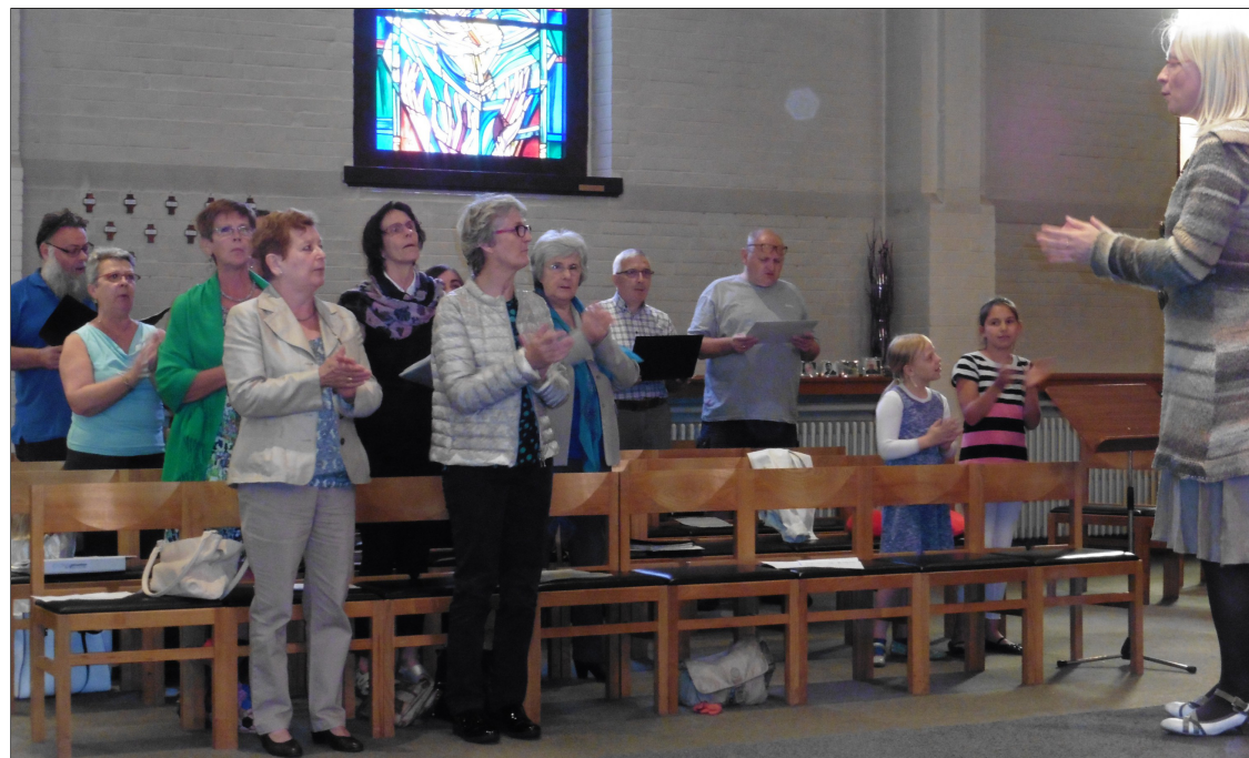
Gij alle volken, klapt in de handen, juichend en zingend, dansend en springend. Gij alle volken, klapt in de handen, looft Jahwe, looft Jahwe.