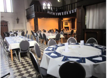
Antoniusruimte achter de kerk met bar 122,40 m 2