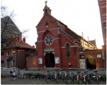
Locatie zalen op de buitenring rond Leuven

Zalen voor groeps- en familiebijeenkomsten Léon Schreursvest 33 te 3001 Heverlee