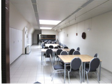
Kristoffelzaal naast de kerk met bar 92 m 2