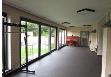
Terras achter de kerk 40,26 m 2