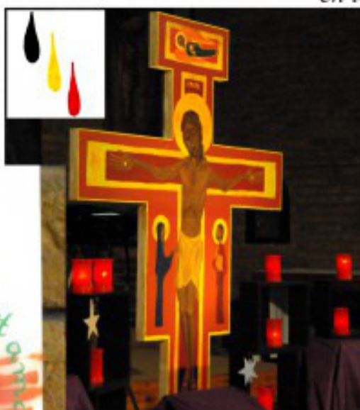
Foto kruis en kaarstekening: Thierry Van Craenem Opschrift paaskaars: ubi caritas et amor deus ibi est